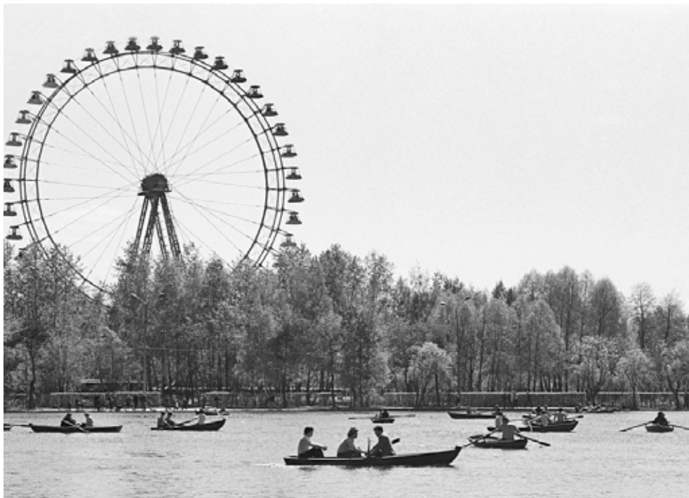
Наум Грановский ЦПКиО им. Горького. Вид на пруд и колесо обозрения. 1965

Многое из того, что Грановский снимал в 50-е – 80-е годы уже не существует: снесены гостиницы «Интурист» и «Россия», не осталось самого большого в СССР открытого бассейна «Москва» и любимого многими колеса обозрения в Парке Горького. Более ста работ автора, представленных на выставке, покажут, как менялась столица и развивалась советская архитектура на протяжении шестидесяти лет. Это позволит зрителям не только вспомнить о забытых страницах в истории города, но и оценить то, что мы теряем на глазах сегодня.