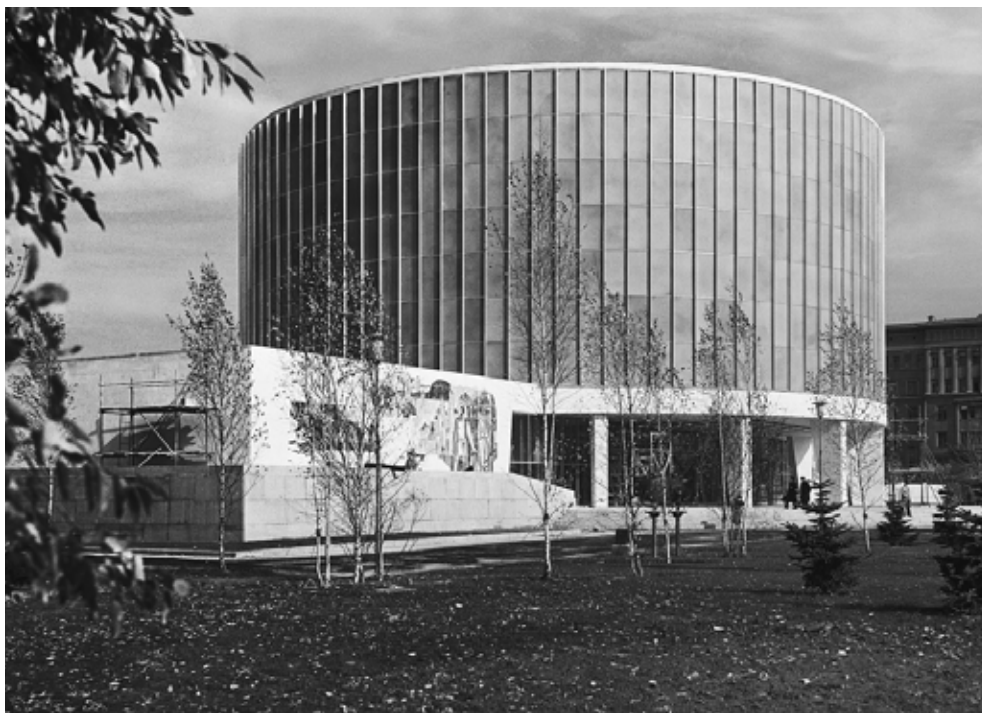
Музей-панорама «Бородинская битва». 1960-е