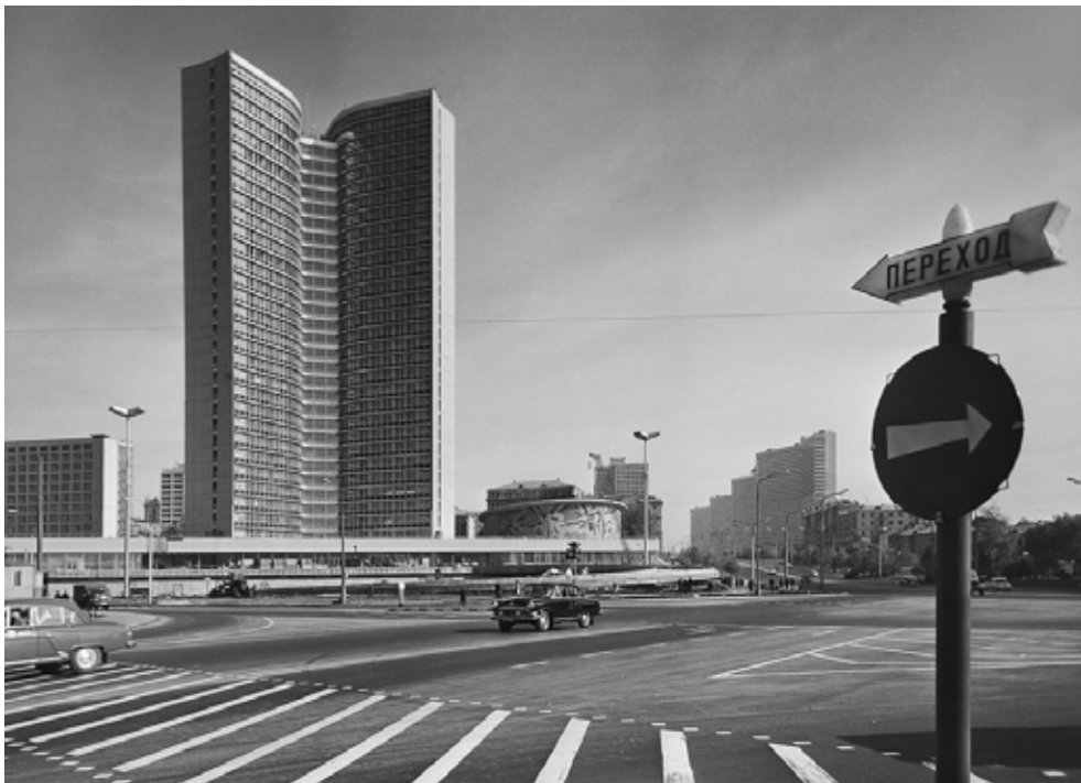
Наум Грановский Здание СЭВ. 1968

«Московский летописец», «главный архитектурный фотограф СССР» – так называли его современники. На протяжении более чем полувека Москва оставалась главным героем на фотографиях Грановского, он смотрел на неё как на живого человека, отмечая все изменения, которые с ней происходили. Он приходил на одни и те же улицы и площади, последовательно собирая меняющийся облик Москвы XX века.