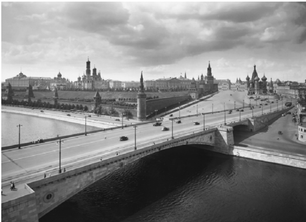
Наум Грановский Вид на Москворецкий мост и Московский Кремль. 1939

В 60-е годы были изданы несколько серий открыток «Москва старая и новая», где его первые фотографии сравниваются с современными на тот момент снимками. С конца 70-х по 1985 год фотографии Грановского публиковались в газете «Вечерняя Москва» под специальной рубрикой «Москва вчера и сегодня», в которой сравнивались кадры, сделанные им с одной точки съемки в 30-40-е и 70-е годы.